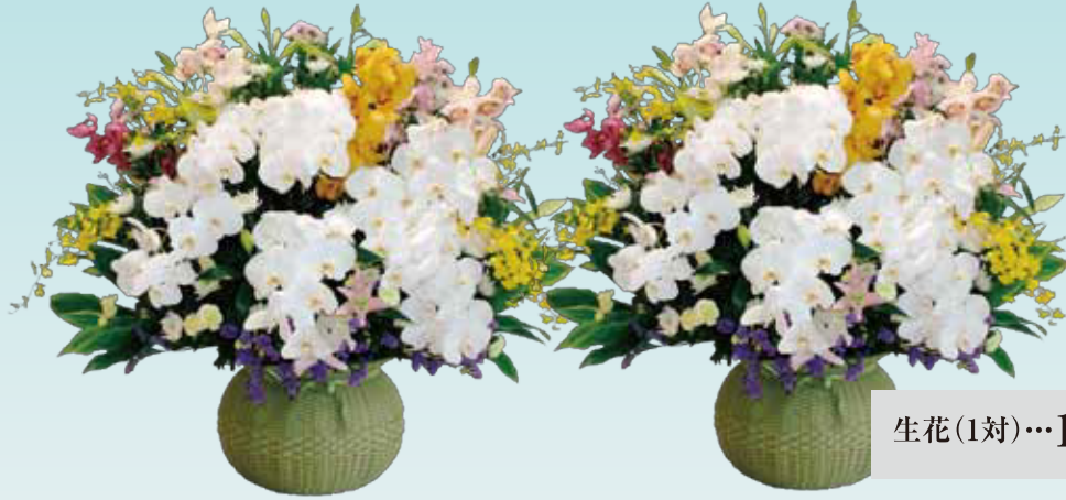
生花(1対)…110,000円(税込) 100,000円(税抜)