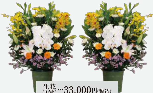
生花(1対)…33,000円(税込) 30,000円(税抜)