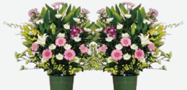
生花(1対)…22,000円(税込) 20,000円(税抜)