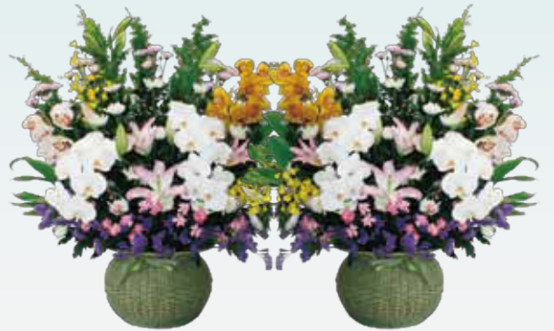
生花(1対)…55,000円(税込) 50,000円(税抜)