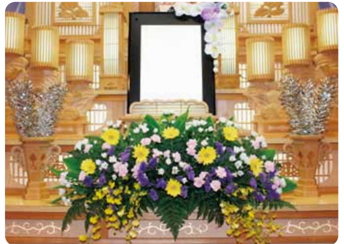
前花……………22,000円(税込) 20,000円(税抜)