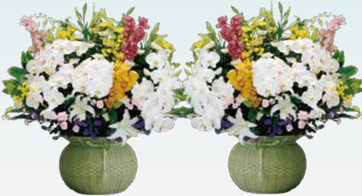
生花(1対)…77,000円(税込) 70,000円(税抜)