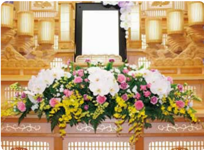
前花……………33,000円(税込) 30,000円(税抜)